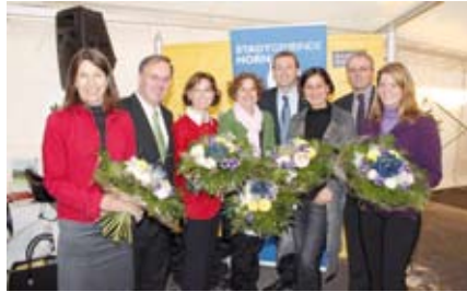
Für die „beteiligten“ Damen gab es Blumen.