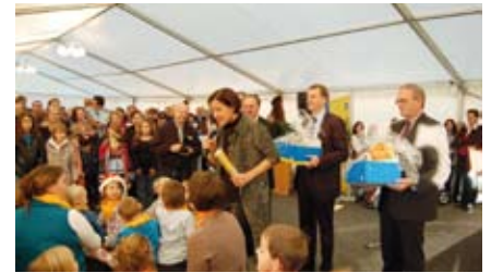
Für die Kinder gab es zahlreiche Geschenke.

Besondere Anliegen seien ihr, dass auch 2,5-jährige Kinder Platz finden und dass die Kinder von klein auf mit der englischen Sprache vertraut sind. LR Mag. Mikl-Leitner versprach, dass in NÖ Landeskindergärten auch in Zukunft pädagogische Qualität oberstes Gebot ist.